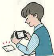
証明書等のアップロード