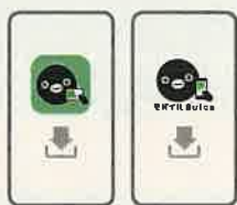
アプリをダウンロード