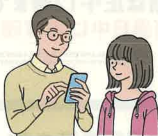
クレジットカード情報の入力