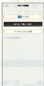
支払い方法は「ワンタイムクレカ決済」を選択

「ワンタイムクレカ決済」とは、モバイルSuica通学定期券をご購入いただく際及び、Apple PayのSuica新規発行の際に、モバイルSuica会員本人がクレジットカードをお持ちでなくても、保護者等のクレジットカードによる決済を可能とするサービスです。クレジットカード番号等の情報がアプリ内に残ることはありません。