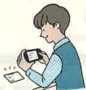
定期区間・経路等の入力後、通学証明書等をアップロードして予約