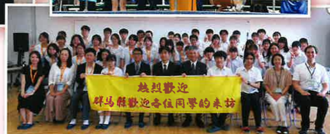
香港の学校との対面交流