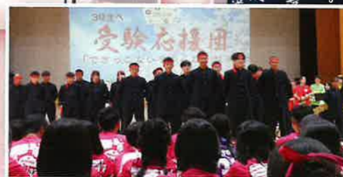
3年生へ受験エール