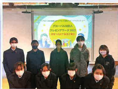
グローバル始動人プレゼンアワード