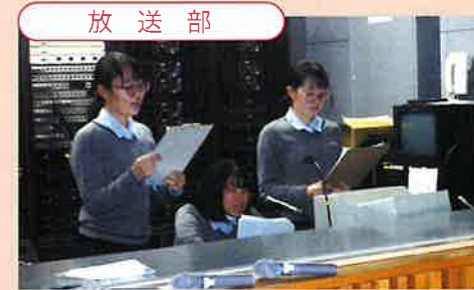
県総文祭優秀賞・県代表他多数入賞