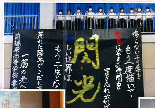
書道パフォーマンス