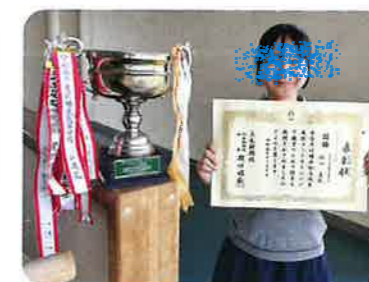
スピーチの部 優勝