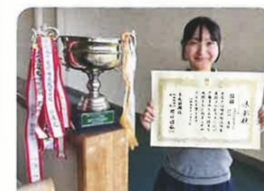
スピーチの部 優勝