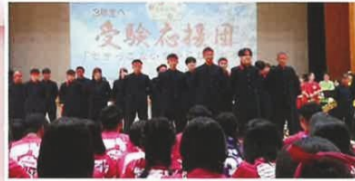
3年生へ受験エール