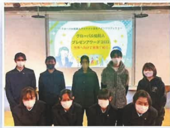
グローバル始動人プレゼンアワード