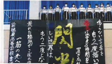
書道パフォーマンス